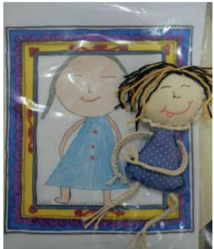
Projeto realizado na APAE de Bebedouro com adolescentes/ deficiência intelectual: Construindo minha identidade

Arteterapeuta, um encantador de caminhos, fala de um trabalho que encanta e alimenta o ser arteterapeuta, seja na prática de estudos e pesquisas, no contato com o outro ou com grupos, empresas, escolas e outras instituições. Mas, para entendermos o que é ser um encantador de caminhos é necessário falar primeiro do caminho a ser percorrido para sua formação e aprimoramento, até se transformar no profissional que, segundo Tommasi (2011) "carrega dentro de si um grande potencial: a certeza de que a vida pode ser melhor quando vivida com arte", e que