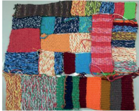
Projeto: Tecendo novos caminhos. Atividade em grupo: "Colcha de retalhos"... Juntos, somos mais fortes

Assim faz o encantador de caminhos, vive com arte e pela arte, vive com a energia do amor e com cor, sabe como transformar a dor, vive com a luz e sabe o momento exato de apertar o botão e acabar com a escuridão, transforma o choro em um rio de possibilidades, possibilitando andar por um caminho encantado, onde o sentir faz sentido.