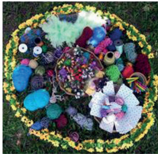
Centro "mandala", elaborado para recepção e produção das atividades durante eventos, oficinas e vivências arteterapêuticas em grupo.

Cuidar é uma palavra chave em contextos relacionais nos quais se procura acolher o outro com objetivos terapêuticos. Tomassi (2011) diz que o cuidado é um processo de dedicação contínua, de discernimento, de atenção, de criação e manutenção do vínculo.