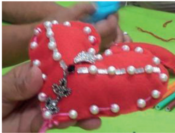
Atendimento individual sobre as necessidades do coração: Do que o meu coração precisa?

Durante o curso, o futuro arteterapeuta não só adquire conhecimento teórico nas áreas discriminadas no parágrafo anterior como também experimenta os mais diversos materiais e técnicas das artes plásticas. Tal experiência o habilita na percepção das qualidades e efeitos dos materiais para que possa utilizá-los de forma adequada com seus futuros clientes. Desenvolver a própria sensibilidade pelos meios, conhecer suas aplicações é imprescindível para sua capacitação.