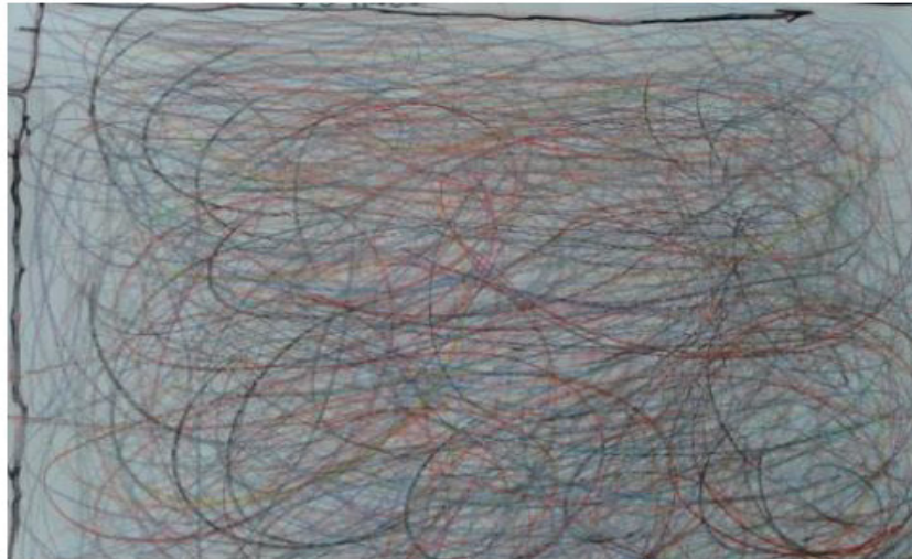
Figura 1- Rabiscos de F1.

dar asas à imaginação, é soltar, é se envolver com o que se tem para contar” (CHRISTO e SILVA, 2009, p.41).