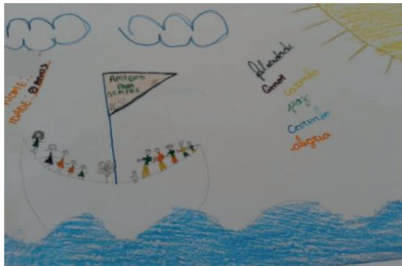
Figura 2 – Desenho livre de F1.

Na figura 1 pode-se perceber que a participação de F1 na atividade foi intensa e mostrou que estava satisfeita por produzir os rabiscos, com ênfase nos traços circulares. Ao se observar o desenho percebe-se o emaranhado de linhas que formam um espaço confuso, caótico, sem entradas e sem saídas, não se sabe onde está o começo e o fim.