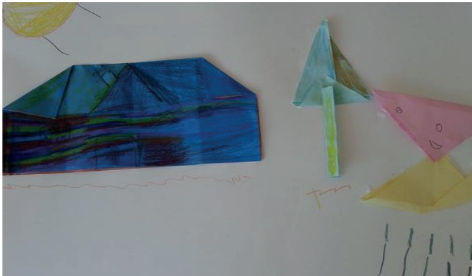
Figura 4 – Painel com origami de M1.

F1 sente necessidade de se expressar em palavras escritas, fixando assim seu pensamento. A palavra escrita tem força e poder de materialização. Não se conhece a casa real de F1, mas ao descrevê-la, pintá-la, desenhá-la, ou dobrá-la, F1 dá vida a sua imaginação, pois pode criar a sua casa interior e satisfazer os seus desejos mais secretos. O tema do regresso está presente nos mitos e contos de fada, quando o herói ou heroína após passar por muitas provações, encontra o caminho que o conduzirá ao lar, pois como afirma Doroty no conto O mágico de OZ : “Não há lugar no mundo como a nossa casa”. A esperança de retorno e de encontrar um quarto só seu, fortalece F1 a cada dia. Por isso sua casa têm onze janelas e quatro portas, que embora estejam fechadas neste momento, são aberturas para novas possibilidades de relacionamentos afetivos.