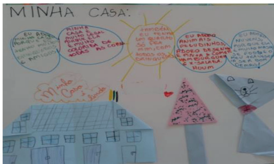
Figura 3 – Painel com origami de F1.

Na segunda oficina aplicou-se a técnica do origami. Os objetivos específicos foram: desenvolver a concentração, a precisão, o cognitivo e o motor; desenvolver limites, estimular possibilidades; auxiliar no desenvolvimento do processo imaginativo, simbólico e expressivo; propiciar a autoestima e motivar o relacionamento interpessoal. Após a escolha do papel com determinada cor, elaborar um origami seguindo os passos propostos e depois montar um painel.