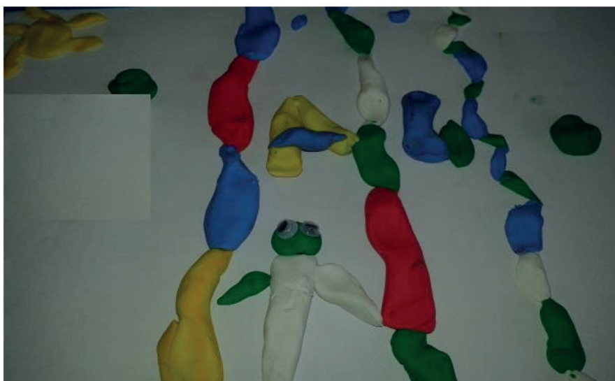
Figura 6 – Modelagem de M1.

De acordo com a figura 6, M1 representou algumas letras do seu nome e desenhou o sol com massinha de modelar.