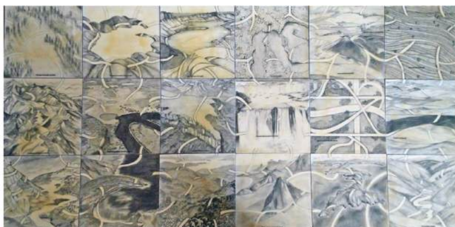
Figura 05- 18 Territórios da Arteterapia

O critério da escolha dos materiais relacionou-se ao custo, reaproveitamento e acessibilidade. As placas de foamboard foram forradas com papel cartolina branca 180g. O papel cartolina e o lápis preto são materiais conhecidos que não requerem altos gastos e conhecimento técnico elevado. Além disso, é possível usar em qualquer ambiente. Cada um dos territórios desenhados com lápis grafite 6b recebeu uma camada de encáustica (cera de abelha + resina + cera de carnaúba). para proteger o desenho e deixar livre a sua manipulação. Era importante que os participantes do Fórum tivessem a experiência tátil da manipulação dos territórios, que pudessem mudar de lugar, passar as mãos, sentir o cheiro e encontrassem caminhos e ressonâncias.