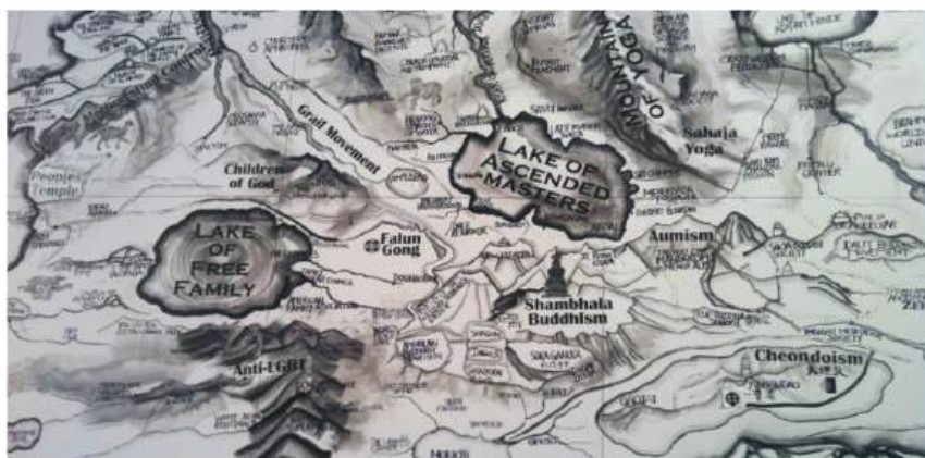
Figura 02 – “Map” de Qiu Zhijie

A primeira imagem de território, ou a imagem primordial para este trabalho, foi a do artista chinês Qiu Zhijie na 31ª Bienal de Artes de São Paulo, que pintou na parede um grande mapa onde foram criados territórios imaginários da cultura.