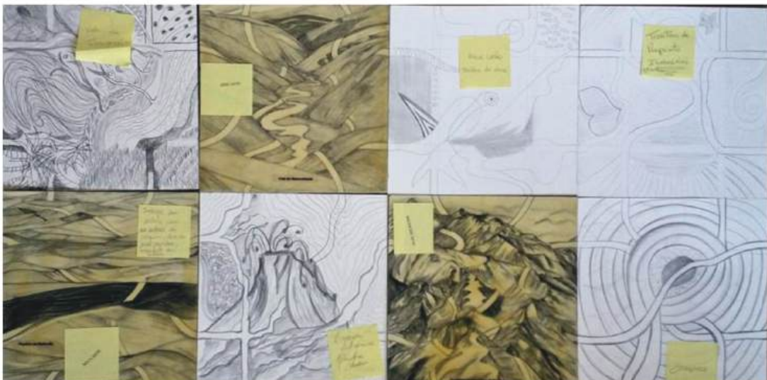
Figura 11- Novos Territórios conectados aos já existentes com interferências dos Post It

Os territórios perdidos, anexados a outros mundos perderam suas conexões rizomáticas, sua razão de ser, sua identidade cultural e relacional. A obra só se completa com o agir do outro e a construção de cartografias onde se mantenham