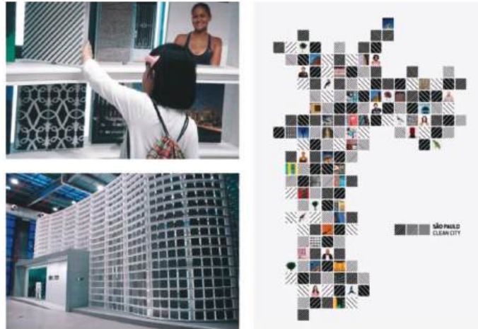
Figura 03- Pavilhão de São Paulo na Expo 2010 em Shanghai

O suporte para os desenhos foram placas de foamboard de 28 x 28 cm que sobraram de uma instalação feita por Dado Brettas na Feira Mundial de Shanghai, representando a cidade de São Paulo em 2010.