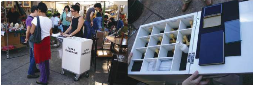
Figura 01- Intervenção urbana "Outra identidade"

pelas ruas da cidade com um carrinho, propondo para que as pessoas troquem ou escolham uma nova identidade.