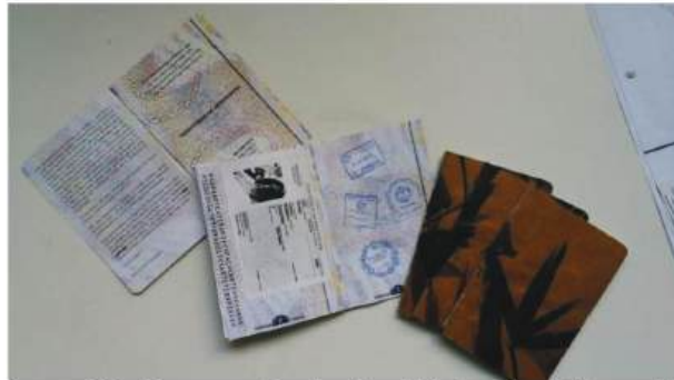
Figura 06- Passaporte dos Territórios da Arteterapia

seus nacionais no país que lhes admite o ingresso em seu território. Foi criado assim o passaporte Passaparte , dos Territórios da Arteterapia, pessoal e intransferível.