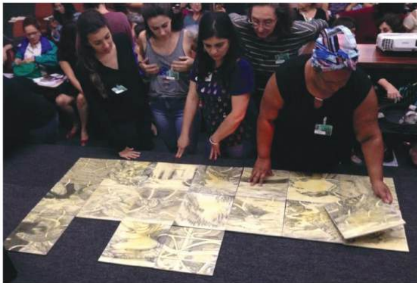
Figura 08- Participantes do VII Fórum Paulista de Arteterapia fazendo as conexões dos Territórios

No final do evento, depois dos debates da segunda mesa, iniciou-se a viagem pelos Territórios da Arteterapia. Primeiro foi passado um vídeo com imagens do cosmo e do planeta Terra visto do espaço para um relaxamento e uma forma de iniciar a jornada. Anteriormente, durante a palestra da segunda mesa, placas dos territórios foram distribuídas aleatoriamente pelo auditório. Foi pedido que cada pessoa segurasse o território e depois o levasse para frente para se juntar aos outros em cima do palco do auditório. A arrumação dos territórios não era fixa e nem obrigatória. A cada arranjo novo foi pedido que tirassem uma foto e enviassem por whatsapp colocando o nome de quem estava enviando. Se quisesse, poderia dar opinião sobre a ação e seus territórios