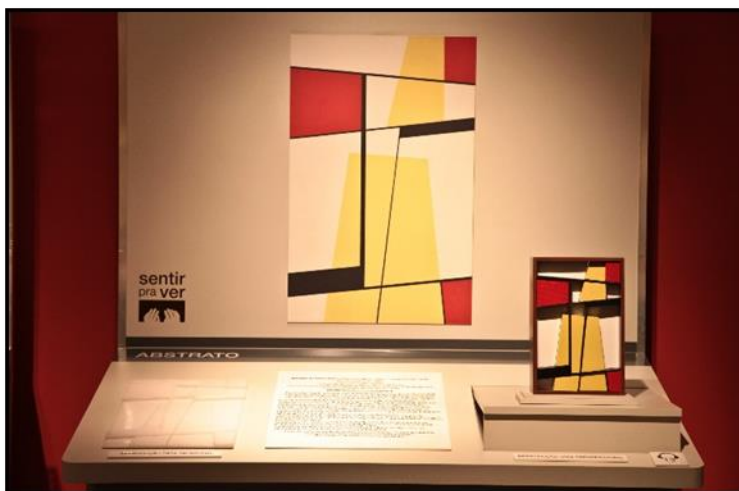
Figura 2 - Bancada Tátil com relevo, maquete tátil e texto em dupla leitura (tinta e braille) Obra: Composição nº 2, Mauricio Nogueira Lima Exposição “Sentir pra Ver: gêneros da pintura na Pinacoteca de São Paulo” Foto: Acervo Arteinclusão Consultoria, 2012