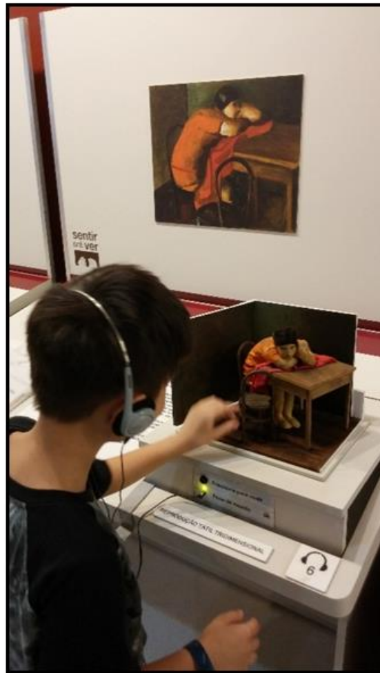
Figura 1 - Maquete Tátil com Audiodescrição Obra: Sem Título , Di Cavalcanti. Exposição “Sentir pra Ver: gêneros da pintura na Pinacoteca de São Paulo

associativos, recursos visuais e sonoros, entre outros), utilizados pelos programas de ação educativa inclusiva como instrumentos de apoio entre o público e o objeto cultural, fator esse fundamental para a compreensão e significação desse objeto, principalmente os públicos com deficiências, limitações intelectuais ou transtornos mentais (TOJAL, 2007).