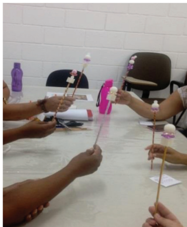
Figura 4 - Construção do Cedro. Todas as participantes da atividade.

ou seja, não permite que seja retirado o poder de si mesma. É uma das deusas que integra o grupo de deusas vulneráveis, modelo proposto por Diniz.