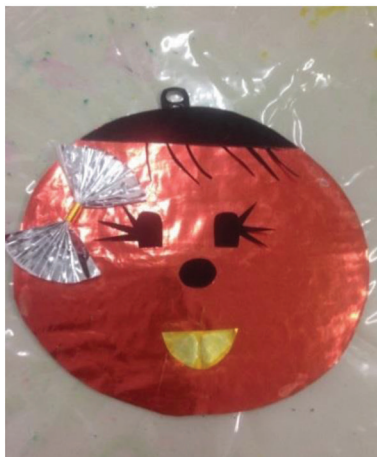
Figura 5 - Presente a si mesmo. Participante M1.

A figura 6 é da atividade de confecção de uma boneca, fundamentada na deusa Perséfone e o mito de Coré. A boneca escolhida foi a Abayomi – que significa “algo precioso” que as mães confeccionavam aos filhos nos navios negreiros. Utiliza-se de tecido de cor preta e retalhos coloridos e tesoura, é feita com nós, sem costura. A boneca simboliza a transição emocional da dependência para a independência emocional da menina com a mãe. Os autores Woolger e Woolger (2007) citam que este rito de transição é importante quanto ao posicionamento da mulher no que diz respeito às relações afetivas que irá vivenciar, ou seja, a autonomia emocional que passa a conquistar em relação à mãe também refletirá nos relacionamentos conjugais. Portanto, a atividade é uma ferramenta que ao mesmo tempo revive o aspecto Coré e propõe sua transição ao aspecto adulto do arquétipo desta deusa.