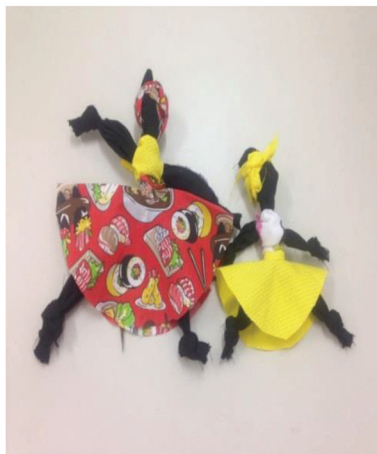
Figura 6 - Boneca Abayomi – participante S1

Afrodite é definida por Diniz (2015) como uma deusa Alquímica, isto significa que o arquétipo desta deusa aborda uma mulher fortalecida, que se comunica de forma assertiva nas relações interpessoais, valoriza o que é belo não no sentido meramente estético, mas no aspecto das potencialidades. Afrodite auxilia na comunicação adulta entre parceiros, na criatividade e na autoestima da mulher que se conecta ao seu arquétipo. Para esta deusa foi utilizada a atividade de decoração em espelho, ilustrada na figura 7. O intuito foi de repensar o olhar que se tem para as relações, para o potencial criativo e as expectativas. O material utilizado foi espelho, miçangas, papel camurça e cola quente.