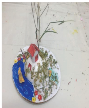
Figura 3 - Santuário interior – Participante A1

Hestia é definida por Diniz (2015) como a deusa mais velha, simbolizada pela solidão, ou seja, o estar sozinha consigo mesma. Este arquétipo é de grande relevância para intervenções que se proponham a fortalecer a introspecção e o aconchego de pertencer a si mesmo. Foi proposta atividade de construção do Santuário Interior de cada uma, simbolizando a auto referência como um fator de fortalecimento. A figura 3 ilustra um dos trabalhos produzidos. Os materiais utilizados foram reciclados, bola de isopor, papéis, argila e tinta.