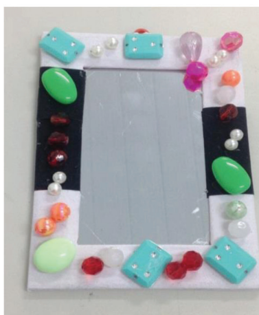
Figura 7 - Decoração de Espelho – Participante S1.

Afrodite é definida por Diniz (2015) como uma deusa Alquímica, isto significa que o arquétipo desta deusa aborda uma mulher fortalecida, que se comunica de forma assertiva nas relações interpessoais, valoriza o que é belo não no sentido meramente estético, mas no aspecto das potencialidades. Afrodite auxilia na comunicação adulta entre parceiros, na criatividade e na autoestima da mulher que se conecta ao seu arquétipo. Para esta deusa foi utilizada a atividade de decoração em espelho, ilustrada na figura 7. O intuito foi de repensar o olhar que se tem para as relações, para o potencial criativo e as expectativas. O material utilizado foi espelho, miçangas, papel camurça e cola quente.