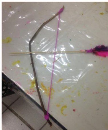
Figura 1 - Arco e Flecha – Participante R1.

A atividade da figura 2 tem influência do arquétipo de Atena, que segundo Diniz (2015) representa uma deusa invulnerável, ou seja, que não aceita a submissão ao outro. É uma figura ligada à vida profissional e traz o aspecto racional que auxilia a obter foco e direcionamento. A atividade escolhida foi o “Olho de Deus”, uma mandala feita com palitos de madeira e lã. Simbolicamente, enquanto as pessoas tecem a mandala, o emaranhado de fios que se organiza para dar forma ao trabalho representa a organização interna emergindo.