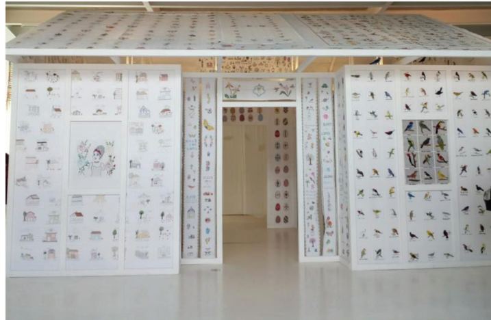
Figura 1 - Exposição "A Casa Bordada"

bordado, reunia 60 participantes de diversas regiões do Brasil, trazendo diferentes tipos de bordados (figura1).