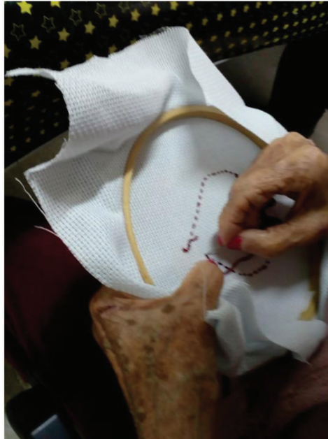
Figura 2 - Atividade de bordado com idosos do Centro de Convivência

memórias e eu como mulher me identificando com a linguagem feminina do bordado, absorvida pela experiência das memórias tão profundas, transpondo o encontro a algo sagrado (Figura 2).