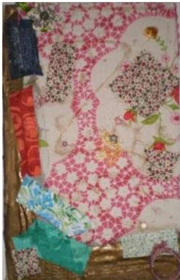
Figura 5 – a família de ANHF: ela, marido e filho

Na antepenúltima sessão, trabalhou colagem com tecidos, botões e fios diversos.