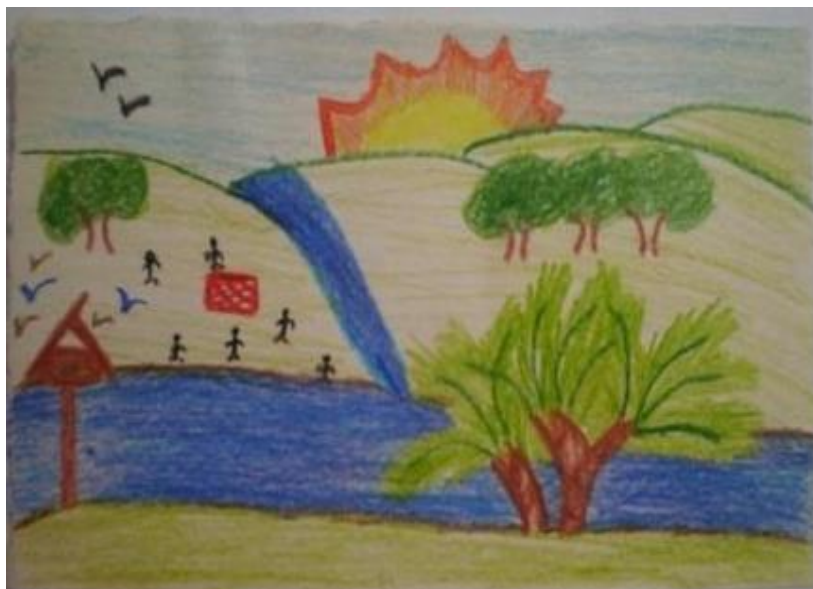
Figura 1 – Crachá de ANHF simbolizando seu nome

Foram 21 encontros e já no primeiro ANHF, como será denominada, mostrou sua fragilidade. Ao fazer um crachá representando o nome (fig. 1), disse que não gostava do seu.