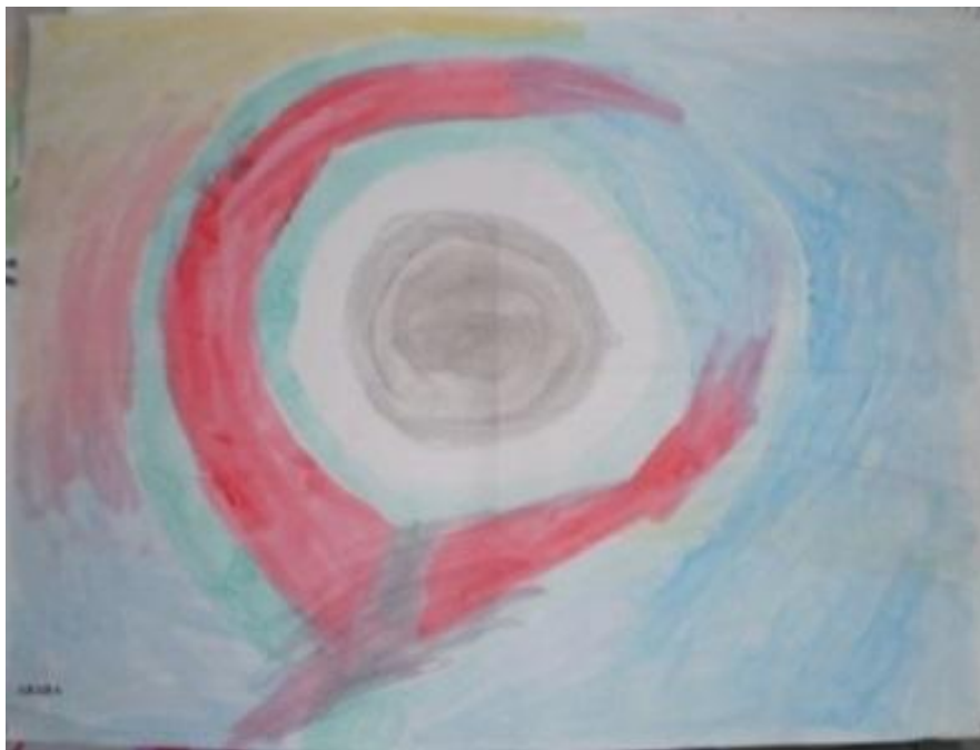
Figura 3 – mandala com a cor da mágoa: o cinza central.