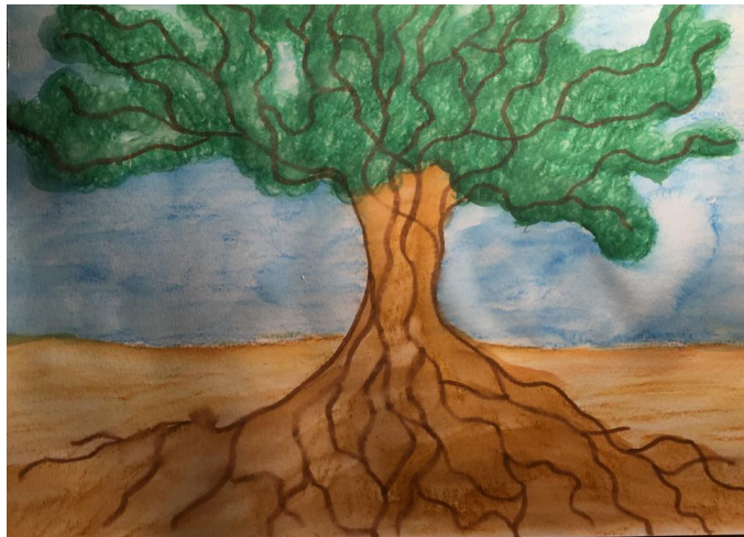
Presença (TPL) - 20/11/2020

Os encontros do elemento ar trabalharam com o mito de Hermes, o deus-mensageiro da mitologia grega, cuja história é narrada por Claude Pouzadoux em Contos e Lendas da Mitologia Grega . Foi feita a mesma adaptação citada no elemento anterior, buscando acentuar o tom pessoal de contação de história. Após a leitura do mito, a proposta arteterapêutica foi produzir um desenho a partir da pergunta: “quais reinos você gostaria de percorrer?”. Gaspar (2018) aponta que o ar representa o nosso potencial de sonhar e criar imagens, que depois podem ser configuradas em projetos. Além de favorecer a coordenação de ideias e da linguagem, o elemento ar também é o símbolo da liberdade, da expansão, da comunicação e da criação – daí a escolha pelo mito de Hermes, relacionado às mesmas simbologias.