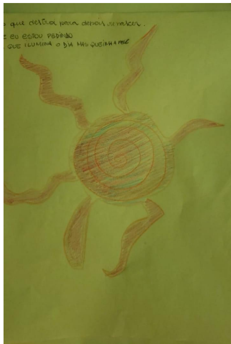
O sol que ilumina o dia, mas que também queima a pele (GM) - 16/10/2020

Nas oficinas, os encontros do elemento fogo trouxeram as ideias da intuição humana e da dualidade, trabalhando os aspectos de luz e sombra dos participantes. Como nos aponta a autora, o fogo nos permite entrar em contato com a luz de maneira mais rápida, possibilitando a iluminação dos aspectos sombrios.