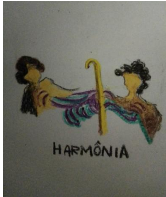
Harmonia (BN) - 02/10/2020