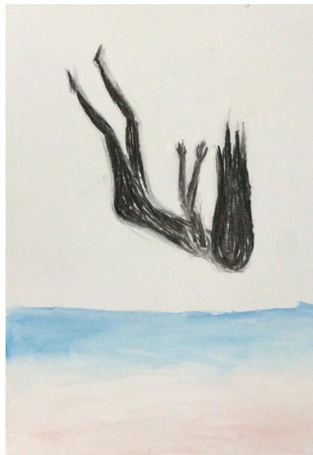
Lágrima (LP) - 09/10/2020

Alguns participantes relataram incômodos frente ao que denominaram como “mito mórbido”. Por outro lado, o motivo dos peixes como elementos de resgate apareceu mais de uma vez nos desenhos, assim como a ideia de novas possibilidades relacionada a esses animais.