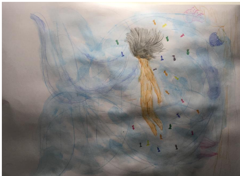
Submergir para emergir (TPL) - 06/11/2020