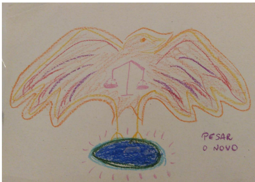
Pesar o novo (BL) - 11/12/2020