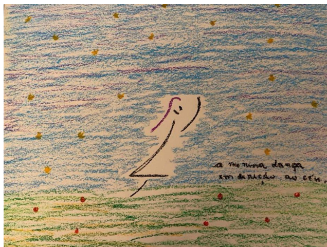
A menina dança em direção ao céu, mas ela quer criar raízes (GL) - 30/10/2020