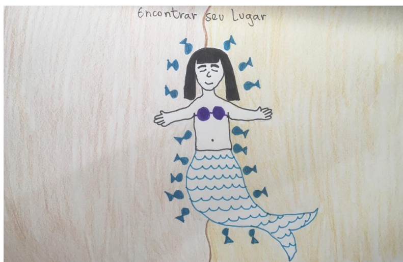
Encontrar seu lugar (KO) - 04/12/2020

Por fim, nos encontros do elemento fogo o trabalho foi realizado por meio de dois mitos diferentes. Nos dois primeiros encontros foi utilizada a história de Vasalisa, da mitologia russa, adaptada a partir da versão apresentada por Clarissa Pinkola Estés no livro Mulheres que correm com os lobos . No entanto, por acreditar que a história era muito grande e complexa para um encontro de uma hora de duração, no último encontro, foi escolhido o mito da Fênix, adaptado a partir da versão contada por Heródoto na obra História . Ambas as histórias se relacionam com o elemento fogo que, de acordo com Gaspar (2018), está ligado à capacidade humana de iluminar aspectos da realidade, tanto positivos quanto negativos. Além disso, o fogo também se relaciona com a intuição, a criatividade, a transformação, a autoconfiança e a coragem. De acordo com a mesma autora: