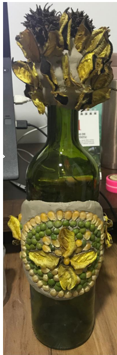
Garrafa & Terra: Encontro 5 Grupo 2 – Estrelícia

Como uma folha de papel branco, a garrafa pode ser o ponto inicial para expressão artística em composição com outros materiais. As vivências arteterapêuticas realizadas com o grupo 2 integraram à garrafa outras matérias-primas, como argila, massa de modelar, colagem de papéis, modelagem com imagens de revistas, tecidos, crochê, aviamentos, adereços com brilho, sementes, folhas secas, giz de cera derretido e pintura.