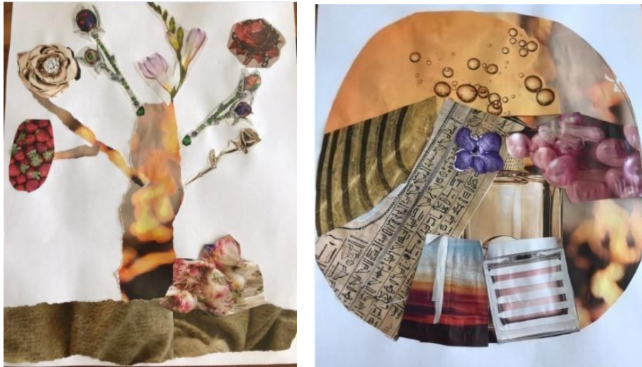
Árvore com colagem e Mandala: Encontro 3 e 4 – Dália

Nos encontros individuais com Dália, por exemplo, em cinco das nove vivências foram trabalhados procedimentos com colagem. Na figura da árvore, realizada no terceiro encontro, o elemento principal trabalhado foi a rosa e, entre as imagens de jóias, nota-se que uma das rosas, do lado direito, estava acorrentada.