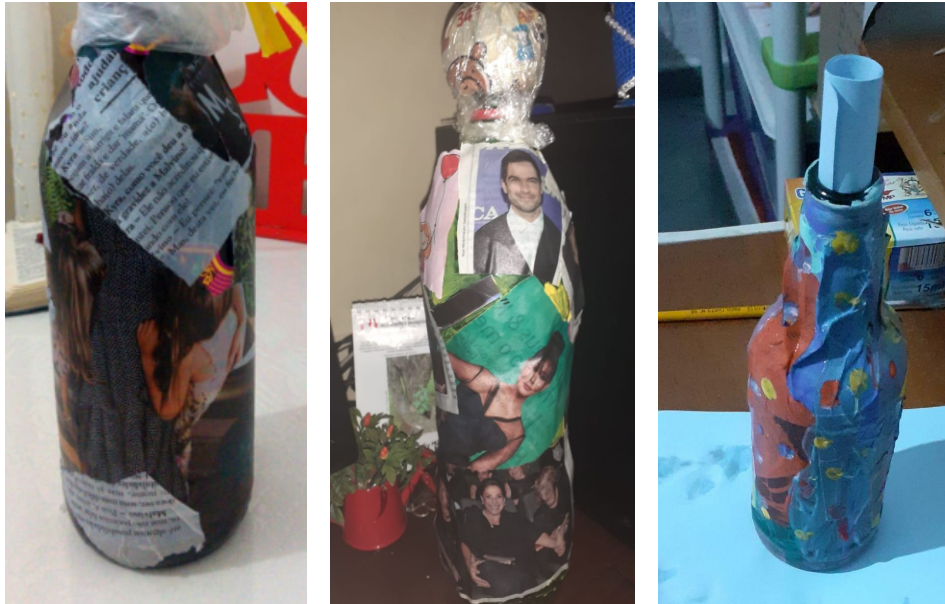
Garrafa & Água: Encontro 10 Grupo 1 – Tulipa e Prímula; Encontro 8 Grupo 2 – Camélia

O processo de imersão na água gerou uma intensa libertação de sentimentos tóxicos, após uma certa angústia inicial, ressignificando memórias, gerando fluidez e leveza. Uma das participantes, Camélia do Grupo 2, por exemplo, transmutou a dor de um processo de separação, que veio à tona, a qual pensou já ter superado há anos.