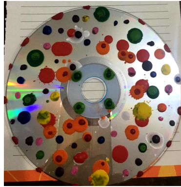
Mandala com Fogo: Encontro 5 – Lótus 1

O trabalho com a sucata propicia o estímulo à criatividade através da construção e reconstrução do concreto e real. Configura-se num material transformador, pois se fornece uma nova utilidade ao que antes era lixo. Traz a mudança através do concreto, facilita a busca de possibilidades de transformação em todos os níveis. Por poder ser aliada à pintura, à colagem e à modelagem, apresenta-se como uma atividade rica e complexa, que pode mobilizar os conteúdos inconscientes, transformando-os, e ressimbolizando-os de forma benéfica. (NAGEM apud PHILIPPINI, 2013, p. 26)