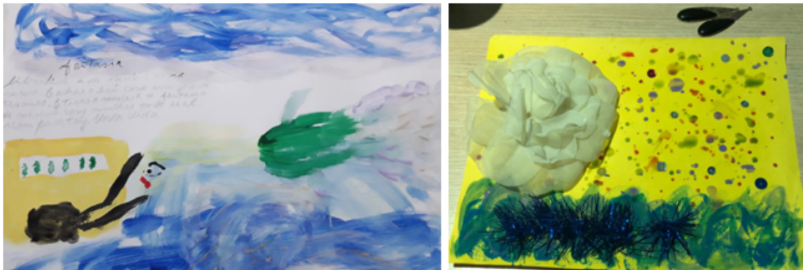
Mergulho da sereia: Encontro 8 Grupo 1 – Estrela Nascimento de Vênus: Encontro 7 Grupo 1 – Jasmim

Uma das vivências propostas foi visualizar o mergulho no mar, acompanhando o movimento corporal de sereia apresentada da tela. Em um momento, a imagem parava e, ao fechar os olhos, as mulheres foram direcionadas a abrir um baú no fundo do mar. O que viram dentro do baú foi expresso com tinta aguada em papel, trazendo para a maioria suas preciosidades. Ao sair do mar, encontraram ainda uma garrafa com uma mensagem dentro, direcionada para elas, e reescreveram o que ali dizia. Esse papel foi guardado dentro de uma garrafa de vidro, que viriam a continuar trabalhando em próximos encontros.