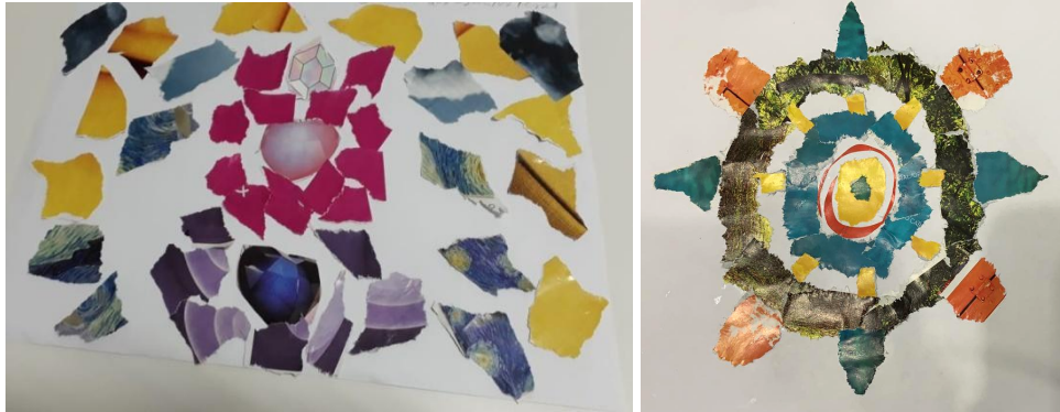
Mosaico de Papel: Encontro 4 Grupo 1 – Estrela Mosaico de Papel: Encontro 3 Grupo 3 – Lótus

(...) As experiências com mosaico nos auxiliam a organizar o mosaico interno de afetos, emoções e memórias. A atividade de reunir cacos permite partir de um caos e de uma desconstrução para, passo a passo, ressignificar, reconstruir, atribuir um novo sentido e descobrir beleza no material quebrado, descartado, amontoado e confuso. (PHILIPPINI, 2018 p. 82)