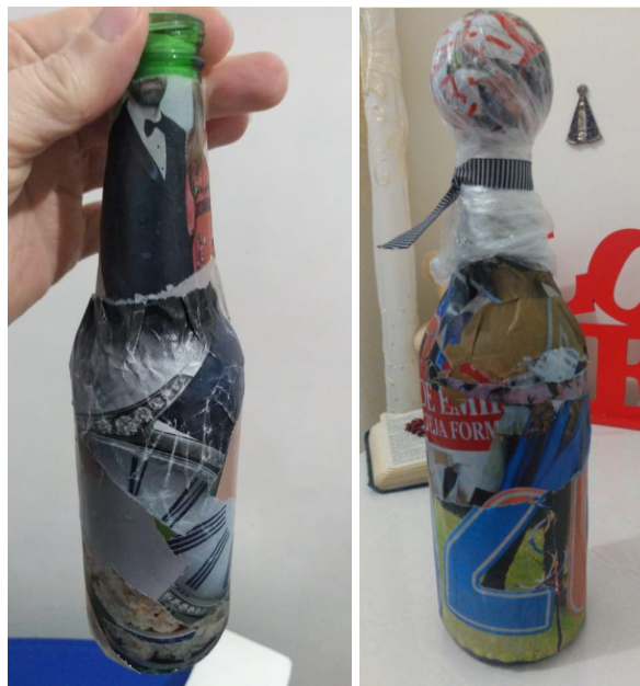
Garrafa & Água: Encontro 8 Grupo 2 – Petunia e Encontro 10 Grupo 1 – Begônia

Além do reaproveitamento, entre outras vantagens do reuso de materiais estão a diminuição da poluição da água, do solo e do ar, que se relaciona com a própria natureza humana; redução da acumulação progressiva de resíduos, nocivos à saúde; melhoria da qualidade de vida. Fazendo uma analogia com o processo arteterapêutico, simboliza um renascimento, uma renovação do ser, a partir do que se considerava sem vida, por meio do manuseio do material reaproveitado, que funciona como um aliado no trabalho terapêutico.