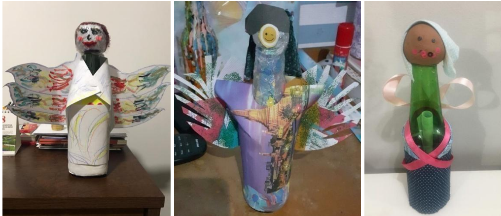
A Libertação: Encontro 9 Grupo 2 – Camélia e Estrelícia; Encontro 7 Grupo 3 – Lírio

Para finalizar, foram realizadas práticas com os grupos com a construção de uma boneca com asas, por meio da sensibilização do mito da deusa Ísis, deusa da fertilidade e da magia, que detém os segredos da vida, da morte e da ressurreição, também considerada a deusa dos quatro elementos.