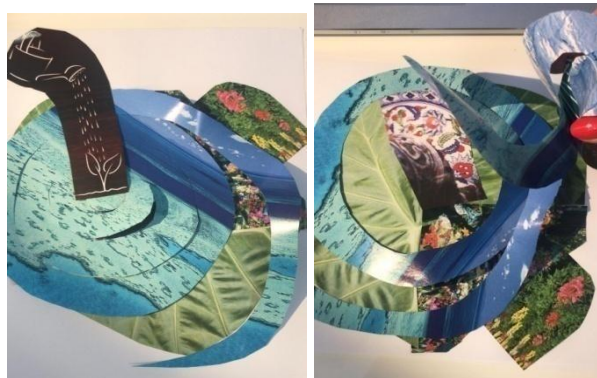
Mandala tridimensional: Encontro 9 – Dália

O uso da colagem a partir de recortes de revistas pode acontecer de formas diversas. Nas práticas arteterapêuticas realizadas, a colagem foi utilizada na criação de árvores, mandalas, livre expressão, colagens tridimensionais e outras construções com uso de tesoura ou rasgos manuais.