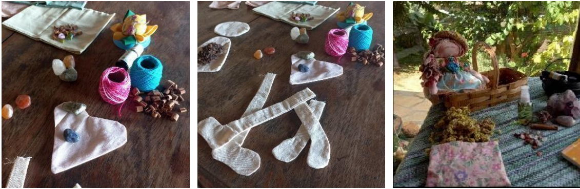
Imagem 1. Os materiais utilizados na construção das Bonecas.