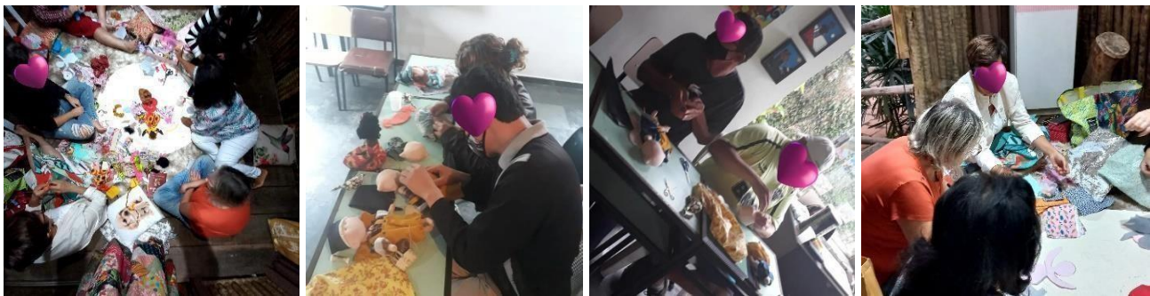
Imagem 2. A dinâmica da construção das Bonecas na vivência terapêutica.