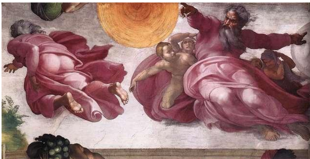
Figura 1. Michelangelo – “A criação do Sol, da Lua e das Plantas”. Fonte: picryl.com 2

Na tese, foi realizada uma profunda análise semiótica da obra: “A Criação do Sol, Lua e Plantas”, obra de Michelangelo di Lodovico Buonarroti Simoni, pintada no teto da Capela Sistina, localizada no Vaticano, Itália, explorando os procedimentos básicos para sua aplicação, sugeridos por Lucia Santaella, especialista nos escritos de Charles Sanders Peirce, um dos fundadores da semiótica moderna, seguindo a lógica triádica do signo e seus efeitos interpretativos, que são: os qualisignos, os sinsignos e os legsignos.