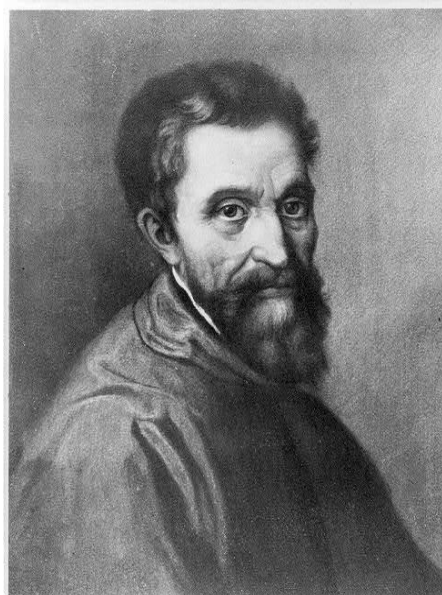
Figura 3. Retrato de Michelangelo. 3

Michelangelo di Lodovico Buonarroti Simoni, foi um expoente artista renascentista, que viveu as mudanças no olhar da arte para o homem e a religião do século XVI. Quando a arte ainda trabalhava para satisfazer às exigências e ditames do clero, ao mesmo tempo em que o artista, sem deixar-se subjugar, buscava sua própria identidade expressiva.