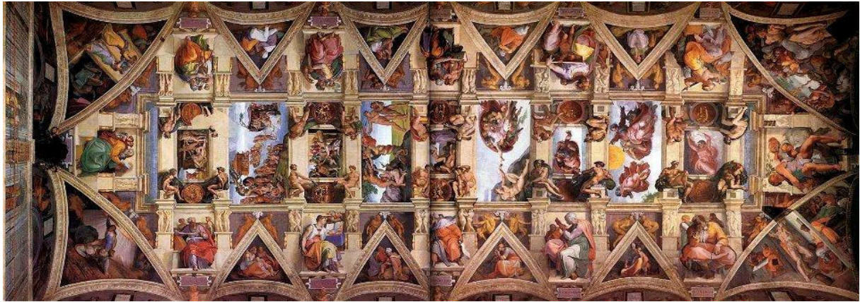
Figura 4. Michelangelo Buonarroti – visão parcial do teto da Capela Sistina – 1508/12, os componentes principais do afresco, são nove cenas do livro bíblico do Gênesis. 4 .

Análise dos processos de signo da obra de Michelangelo Buonarroti – análise semiótica e os efeitos interpretativos. O interpretante, o efeito que o signo é capaz de produzir na mente intérprete, tem três níveis de realização presentes na obra prontos para serem decifrados: