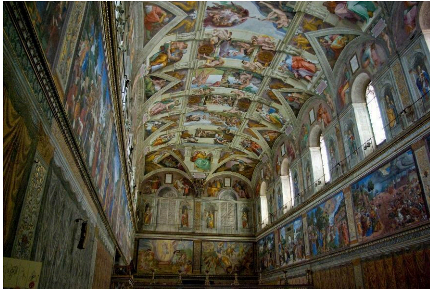
Figura 5. Teto da Capela Sistina com Afresco de Michelangelo. 5

O interpretante imediato (abstrato): Primeiridade – qualisigno = "disponibilidade contemplativa, deixar abertos os poros do olhar; com simplicidade e candidez, impregnar-se das cores, linhas, superfícies, formas, luzes, complementaridades e contrastes; demorar-se tanto quanto seja possível sobre o domínio do puro sensível." (SANTAELLA, 2016, p. 86).