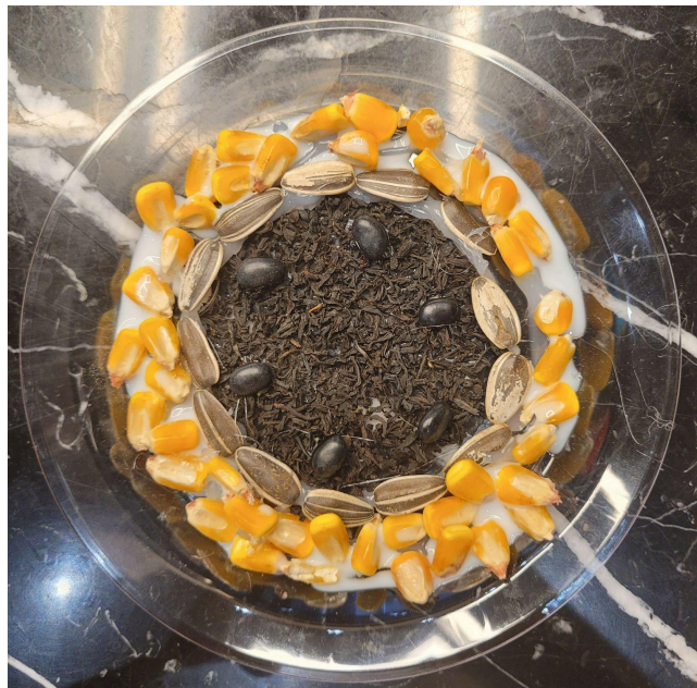
Figura 6. Mandala pessoal do participante FN : “Mundo”.

Ao final da atividade, FN concluiu que deseja fazer mais visitas a sua mãe, que mora no interior.