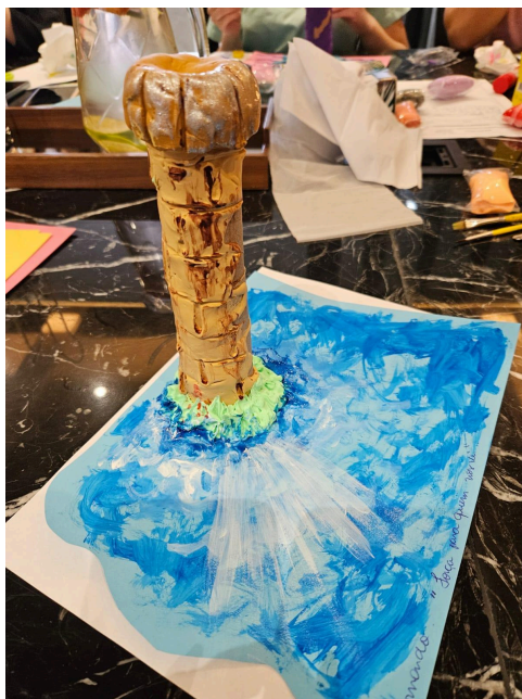
Figura 5. Farol pessoal do participante FN : “Força para quem nos vê”.

O processo criativo de FN exemplifica bem as limitações que o material apresenta, a dança que ele realizou para se adaptar a isso e como fez do erro uma linguagem propícia para a exploração de si: “Eu queria por ele girando, mas a massinha não foi suficiente para cobrir todos os lados, o que fez sentido para mim. Às vezes quero transmitir alegria para alguém que precisa”, – parte da frente do farol –, “quando na verdade não estou tão bem” –parte de trás do farol –, “mesmo assim o outro se fortalece”. Em outra atividade, FN chegou a comentar que sempre tenta “ser um polvo para abraçar os amigos, a família, o trabalho” e acaba “chegando em casa cansado”.