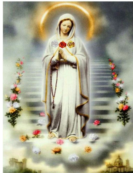
Figura 3. Figura 3 - Virgem Maria.