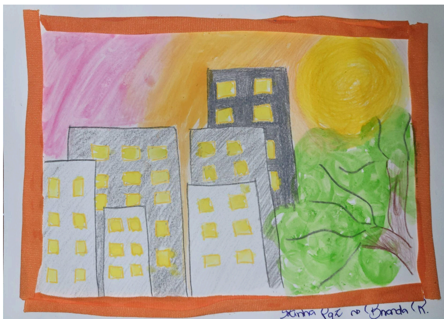
Figura 12. “Minha paz”, da participante BD .

O olhar que antes estava para dentro da casa estava voltado para fora. Explorando retas e curvas, cada um traçou seus caminhos com objetividade, cortando o que deveria ser separado, colando o que deveria ser fixado, retomando seus próprios “fios da meada”, apropriando-se deles e descobrindo suas próprias saídas. Nesta atividade, BD também iniciou a sua produção com lápis grafite, permanecendo em uma área segura.