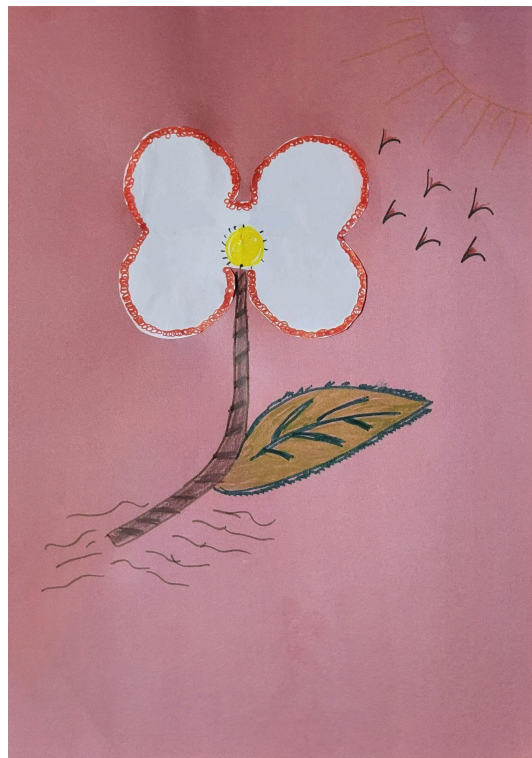
Figura 1. Totem pessoal da participante C .

disponíveis foram riscadores como giz de cera, lápis de cor e caneta hidrocor, pois são de maior familiaridade e acessibilidade no período da infância. Falamos sobre família, ancestralidade, identidade pessoal, gostos pessoais e unicidade de cada um, mesmo com semelhanças entre as histórias de vida dos participantes. Outra etapa da atividade foi o recorte e a colagem, que tem como intencionalidade o sujeito se perceber “destacado” de um todo com suas formas particulares.