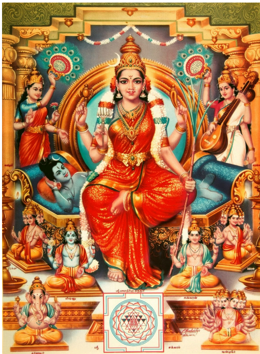
Figura 2. Mãe divina, Tripura Sundari .

A mãe é a segurança do abrigo, do calor, da ternura, da alimentação (CHEVALIER; GHEERBRANT, 2022, p. 650). Sendo assim, C poderia estar entrando em contato com sua mãe interna para se fortalecer do afeto e da compreensão que sentiu no passado. Apesar do cansaço de ser “a base da sua família”, agora, enquanto mulher adulta, deveria buscar a sua própria nutrição, mantendo na mente e no coração o que aprendeu com sua mãe.