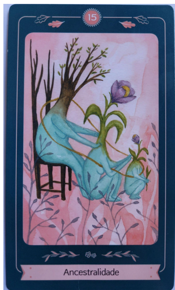
Figura 9. Carta “Ancestralidade” do Oráculo da vida.

O isopor, em vez do tecido, dá mais resistência aos conteúdos que aparecem, além de propor novas maneiras de olhar para um mesmo objeto; e assim como anteriormente foi feito com o rolo de papel higiênico, o isopor ganhou uma nova funcionalidade. No entanto, a sua composição é mais frágil, podendo ser facilmente quebrado, diferente do tecido. Nisso, a atividade exigiu uma busca pelo equilíbrio entre a força física e as suas intenções mentais.