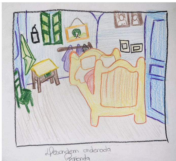
Figura 11. “Desordem ordenada”, da participante BD .

BD iniciou a sua produção fazendo contornos com lápis grafite, como uma estratégia de prevenção e planejamento, ainda na sua zona de conforto. Antes de colorir, percebeu: “Já não tenho mais espaço para colocar coisa”, explicando que desenhou itens demais no quarto. Sua angústia se revelou na sua ansiedade durante o processo, pois constantemente desbloqueava o celular. Foi só quando ela começou a colorir com lápis de cor que conseguiu focar, provando a fala de Carrano e Requião (2022, p. 69), o lápis de cor “trabalha a organização, o limite, a atenção e a concentração”.