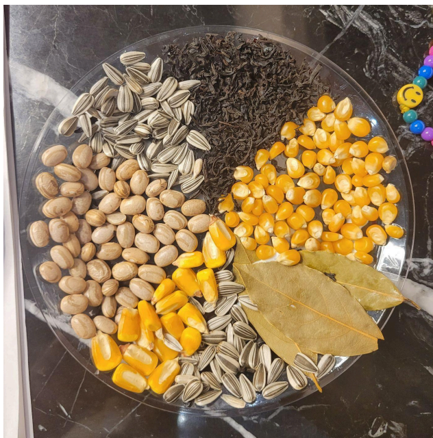
Figura 4. Mandala pessoal da participante C : “Roda das emoções”.

Novamente, apesar de não querer chorar, lágrimas rolaram. Por fim, ela compartilhou o resgate que sentiu com a Arteterapia, referindo-se tanto às memórias do passado quanto às reflexões de como vive no momento atual. Por não ter convivido com sua avó, comentou que através da arte passou a fazer questão de criar bons momentos com sua neta: “Esses dias minha neta quis dormir comigo. Ela nunca fez isso. Acho que estou criando um ambiente acolhedor”. Sua fala mostra que parece reconhecer a sua ancestralidade e aprender com ela a importância de auxiliar aqueles que estão sucedendo a sua existência, como sua neta. É como se, da mesma forma que tem memórias e saudades da sua mãe e de uma avó desconhecida em vida, ela também quer deixar a sua marca nos outros. O que faz sentido com seu título, afinal a roda fornece deslocamento de um lugar para outro, ou seja, C parece ter se permitido deslocar entre as suas emoções em uma busca de ressignificados e novas atitudes, aliviando a tensão iminente no início do processo.