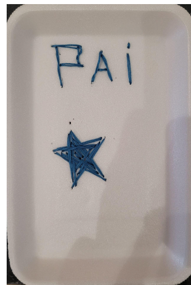
Figura 10. Intervenção no mandala “Olho de Deus”, no grupo FM . Bordado “Pai”, do participante FN .